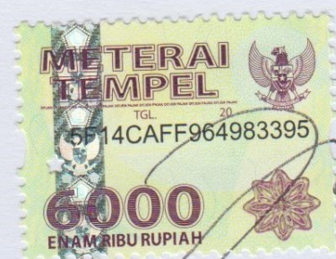
Asep Bagas Nurul Halip